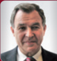
DI Sommerauer Geschäfts- führender Gesellschafter SSP&E Consulting GmbH