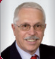
Dr. Wach Konsulent für Bauwirtschaft und Contract- management Unternehmens- berater