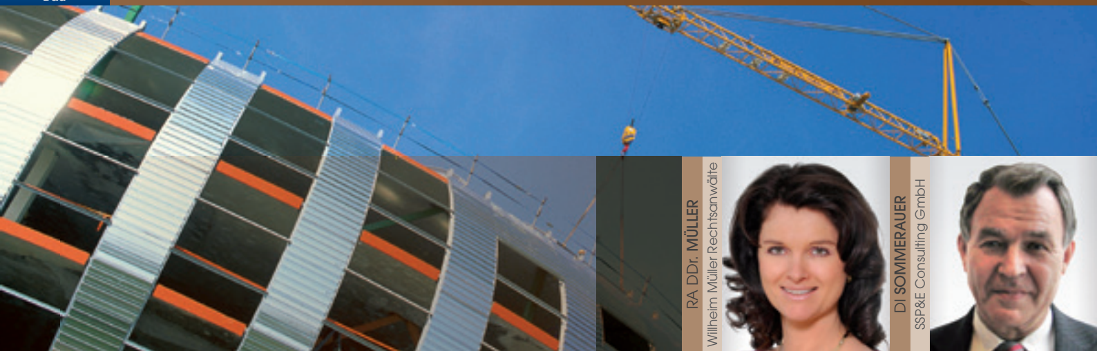
RA DDr. MÜLLER

Rechtliche & bauwirtschaftliche Grundlagen aus der Sicht des Auftragnehmers