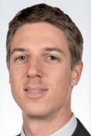
MCG. GAAR Müller Partner RAe GmbH