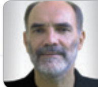
Sen.-Rat DI Kirschner Leiter der Stab- stelle MA 37 Baupolizei