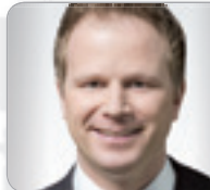
Dr. Kall Rechtsanwalt Müller Partner RAe GmbH