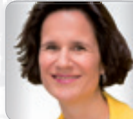
FH-Prof. DI Dr. Link Department Bauen & Gestalten ECC GmbH / FH Campus Wien