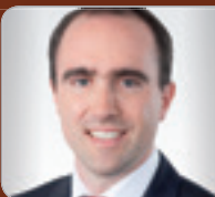
Mag. Dr. Zinnöcker Wirtschaftsprüfer & Steuerberater BDO Austria GmbH