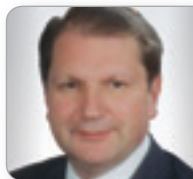
RA Dr. Eiselsberg Experte für Stiftungsrecht Eiselsberg Rechtsanwälte