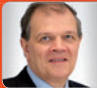
DI Mechtler Bauingenieur FCP Fritsch, Chiari & Partner ZT GmbH