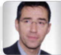
Mag. Koch Richter Oberlandes- gericht Wien