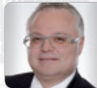
N. Jagerhofer Experte für Versicherungs- möglichkeiten Allg. beeid. u. gerichtl. zert. SV